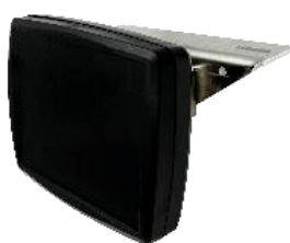
Capteur de détection