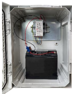
Coffret Éclairage Public